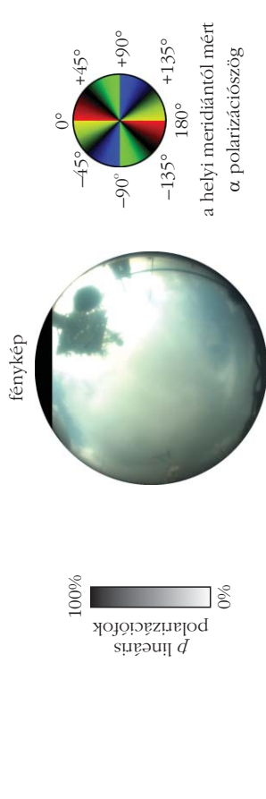
5. ábra. Ugyanaz, mint a 3. ábra , de itt egy majdnem teljesen borult égboltra. A napeleváció 16^\circ volt, a felhőzöttség pedig (a konszenzusos felhőmaszk szerint) 90%.