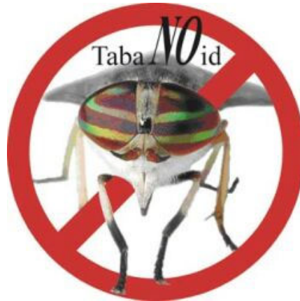
A TabaNoid kutatás-fejlesztési program szimbóluma/logója

vállalkozások számára végzünk kutatást. A szemfüles „ötletvadászok” gyorsan kitalálták a projekt betűszavát, a TabaNOid ot. A bögölyök latinul a Tabanidae családba tartoznak, angolul tabanid fly a nevük, a NO pedig az irtásukra, gyérítésükre utal. E mozaikszó szerepel majd az új, poláros bögölycsapdáinkon is. 2008. áprilisában az MFKK velünk együtt megírta az EU-pályázatot, s megszervezték hozzá a konzorciumot. 2008 őszén nyertünk! A támogatás - körülbelül egymillió euró - nagy részét a kutatást végző partnerek kapják a termék kifejlesztésére, melyből egyetemünknek - s persze nekünk mint ELTE-s kutatóknak - jelentős összeg jár.