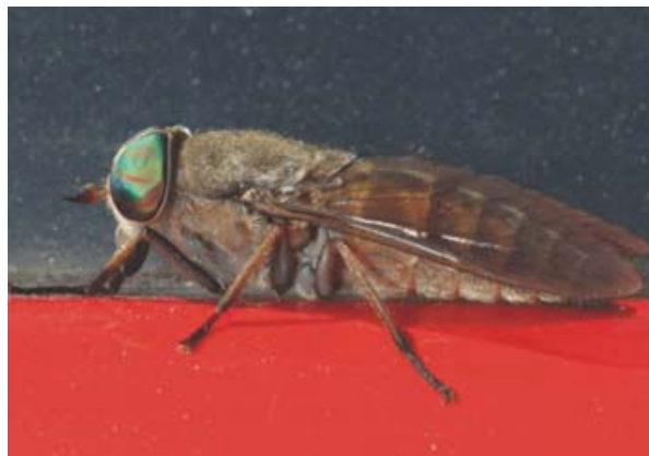
Megtévesztett polarotaktikus bögöly egy piros autótetőn, amely a fényt vízszintesen polarizálja, ezért a bögöly számára „polárosfény-szennyező”

Kezdetben azt sem tudtuk, miért repülnek a bögölyök a vizekre. Napokig ültünk egy vízzel teli, fekete (vízszintesen poláros fényt visszaverő) tálca mellett, s néztük, mi történik. Sorra jöttek a bögölyök, egyszer vagy kétszer érintették a vízfelületet, majd elrepültek. Ittak, vagy egyszerűen csak lehűtötték magukat a hőségben. Amikor nagyon meleg van, például a szitakötők is csobbannak egyet a vízben, utána elrepülnek. Csak kevesen tudják, hogy a bögölyök így viselkednek - mert nem sok szakértő üldögél órákig a víz mellett bögölyöket figyelve. Tübingenben Varjú Dezső biofizikus professzor mindig azt mondta: „Ülj oda, Gábor, és nézd, hogy mit csinál az állat.” Ez ugyanis a kísérleti érzék-biofizikai kutatások egyik kulcsa.