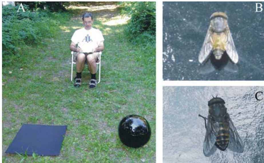
Terepkísélet (A). Azt vizsgálták, hogyan viselkednek a polarotaktikus bögölyök (B, C) a visszavert fényt erősen polarizáló fényes fekete sírköveknél

A projekt mellett tovább folytatjuk a bögölyök csapdázásával kapcsolatos kísérleteinket, így a következő nyáron - életnagyságú műanyag tehénmakkokkal - azt fogjuk vizsgálni, hogy a gazdaállat alakja befolyásolja-e a bögölyök polarotaktikus reakcióit. A sátorcsapdában van egy fekete golyó, amiről az hírlík, hogy azért jó, mert libeg a szélben, s a gazdaállat kontúráját és mozgását utánozza. Az egyik terepkíséletben vizuális vonzó tárgyakként kipróbáltunk egy fekete golyót, egy ugyanakkora felületű vízszintes fekete lapot meg egy fekete tóruszt. Mindhárom ragaccsal kentünk be. A lap 120, a tórusz 4, a golyó pedig csak egyetlen bögölyt fogott. Mértük mindhárom csillogó fekete tárgy polarizációs mintázatait is. A golyó polarizációirány-mintázata olyan, hogy a visszavert fény rezgésirányja „körbejárja” a golyót, tehát csak a golyó teteje és alja polarizál vízszintesen, a többi része nem vonzza a bögölyöket. Hasonló igaz a tóruszra is.