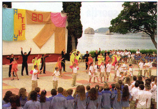
Jubileumi ünnepség 2005-ben Artyekben

liams canterburyi érsek, Tony Blair volt brit miniszterelnök és számos zsidó vallási vezető. A brit eredetű házasság hete egy korábbi egyházi kezdeményezésre telepedett rá: amerikai katolikusok 28 éve szervezték meg Louisianában az első „házasság napját”. Ezt azóta világszerte sok millióan tartják meg február második vasárnapján. A házastársi hűség, önfeláldozás és öröm ünnepéből időközben világnap lett – 1993 óta pápai áldással.